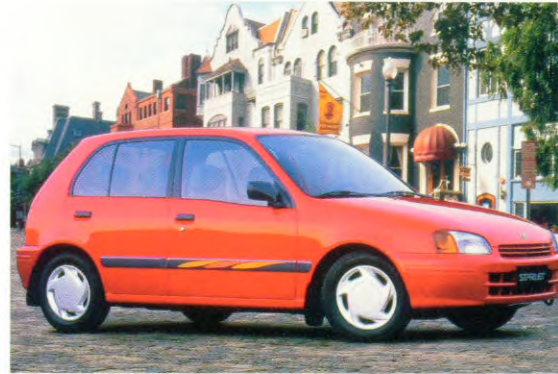
5-deurs GLi (spatlappen extra)

De nieuwe Toyota Starlet is compact van buiten, maar ruim voor de inzittenden en ronduit gróóts in veiligheid, betrouwbaarheid en comfort. Zijn pittige 1,3 liter zestienkleppenmotor garandeert prima prestaties en een aange-naam verbruik. De vlotte vormgeving, zowel sportief als elegant, wordt geaccentueerd door sprekende, modieuze kleuren. En natuurlijk zorgen de fijne motor en het doordachte onderstel voor volop rijplezier.