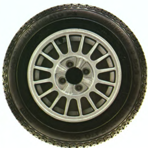
GLS lichtmetalen velg.

Een radio is praktisch niet meer weg te denken in de hedendaagse auto. Al was het alleen maar voor de verkeersinformatie. Daarom kunt u in de LS en in de GL een inbouwkit voor radio tegen meerprijs geleverd krijgen. In de overige modellen is zo'n inbouwkit standaard. Hij bestaat uit twee luidsprekers, 'n antenne en een ontstoringsset. Op de GLS en de SX kunt u ook nog eens - tegen meerprijs - vier fraaie lichtmetalen velgen laten monteren, die uw Horizon een nog fraaier aanzicht geven.