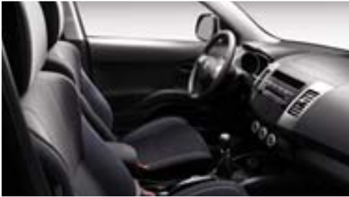
'Knit' donkergrijs, beschikbare stoffen bekleding op SR.