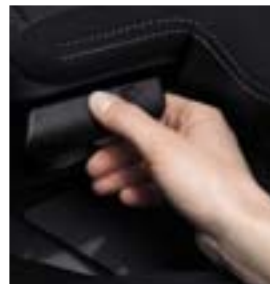
De hendel waarmee u de stand van de achterstoelen kunt instellen.

Achter de tweede zitrij openbaart zich dus een grote, functionele ruimte die volledig is bekleed met zwart moquette. Deze ruimte wordt aan het zicht onttrokken door een bagageafdekplaat. Overigens, met de achterstoelen in portefeuillestand wordt het maximale volume maar liefst 1686 liter (tot aan het dak).