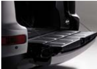
Het onderste deel van de achterklep garandeert een buitengewone toegankelijkheid.