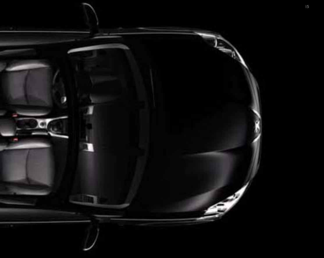
Configuratie 7 zitplaatsen