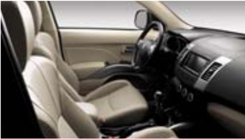
'Dulce Beige', beschikbare lederen bekleding op GT.