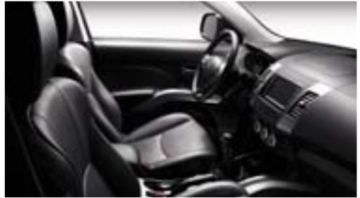
'Dulce Astrakan' zwart, beschikbare lederen bekleding op GT.