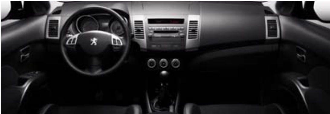
Interieur van uitrustingsniveau GT (boven met optioneel navigatiesysteem afgebeeld).