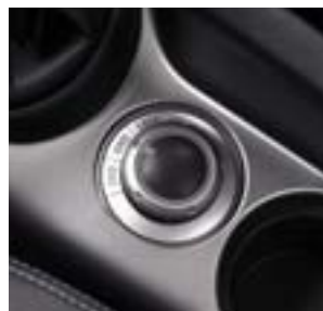
Bedieningsknop van het 'on demand' vierwielaandrijvingsysteem.

Sneeuw, zand, modder, kortom bij zeer extreme omstandigheden kiest u voor de modus vaste vierwielaandrijving (4WD 'Lock'): in deze stand stuurt het systeem, vooral bij lage snelheid, 1,5 keer meer koppel naar de achterwielen dan in de automatische stand en helpt u zodoende de lastigste situaties te overwinnen.