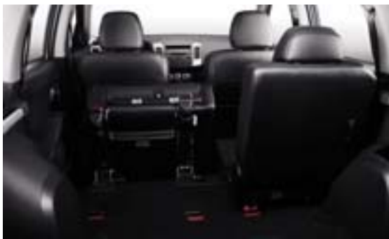
De stoelen op de 2 e zitrij zijn opklapbaar tot in de zogenoemde portefeuilleestand.

verschuifbaar, en kunnen zelfs helemaal worden opgeklapt. Dus het meenemen van veel bagage en/of langwerpige goederen is nooit een probleem. Sommige versies herbergen in de vloer van de bagageruimte een compleet geoutilleerde, opklapbare 2-persoons-bank, waardoor die 4007's tot maar liefst 7 personen kunnen vervoeren.