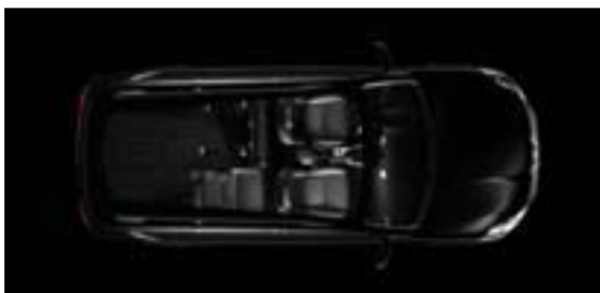
Configuratie 3 zitplaatsen