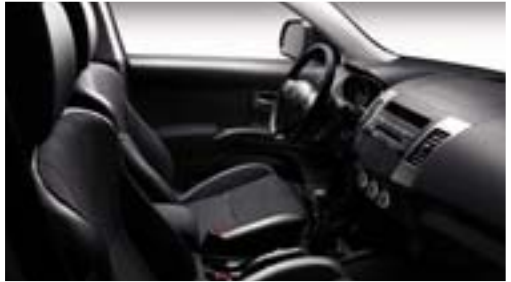
'Diamant' zwart, beschikbare stoffen bekleding op ST.