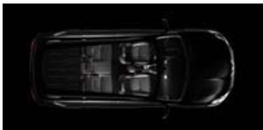
Configuratie 5 zitplaatsen