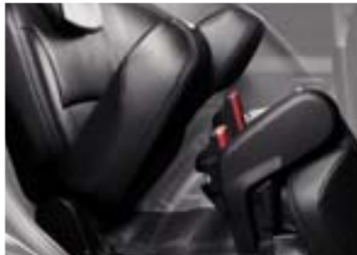
De achterstoelen zijn verschuifbaar, hebben een neerklapbare rugleuning en kunnen in z'n geheel worden opgeklapt.