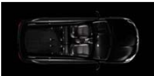
Configuratie 2 zitplaatsen