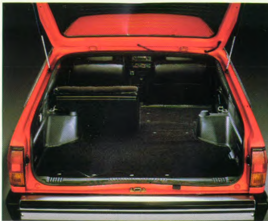
gescheiden, neerklapbare achterbankleuning

De 5-deurs Datsun Sunny Traveller combineert op een unieke manier de luxe en het rijcomfort van een sedan met de extra ruimte van een stationwagen. De "Traveller" werd speciaal ontworpen voor de extra veeleisende gebruikers, die een ruime auto niet uitsluitend voor hun werk nodig hebben, maar die hiervan ook samen met hun gezin willen genieten. Voorzien van alle denkbare luxe en comfort biedt de "Traveller" optimale gebruiksmogelijkheden voor werk en vrije tijd.