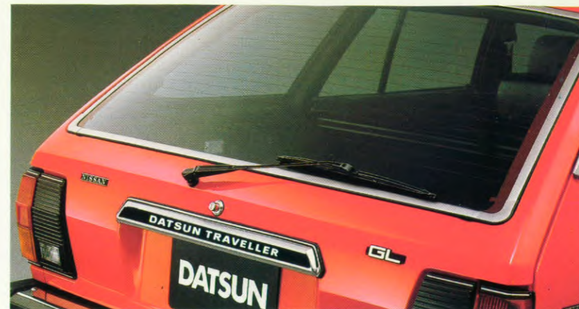
ruitwisser en -sproeier op de achterraut.