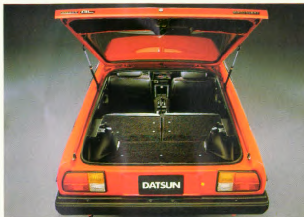
gescheiden, neerklapbare achterbankleuning

De Datsun Sunny is niet alleen leverbaar in 2-, 4- en 5-deurs uitvoering, maar ook in een extra sportieve coupé uitvoering. Een auto met allure, elegant van lijn en praktisch van uitvoering. Voorzien van een krachtige 1400 cm 3 motor en een uitgekiende bagageruimte, die bereikbaar is via een grote derde deur. Door het wegklappen van de rugleuning (of één van de afzonderlijke helften hiervan) kan de bagageruimte aanmerkelijk worden vergroot. Het grote glasoppervlak van de Datsun Sunny Coupé zorgt ervoor, dat het uitzicht schuin naar achteren geen moment beperkt wordt hetgeen vooral gemakkelijk is tijdens het parkeren.