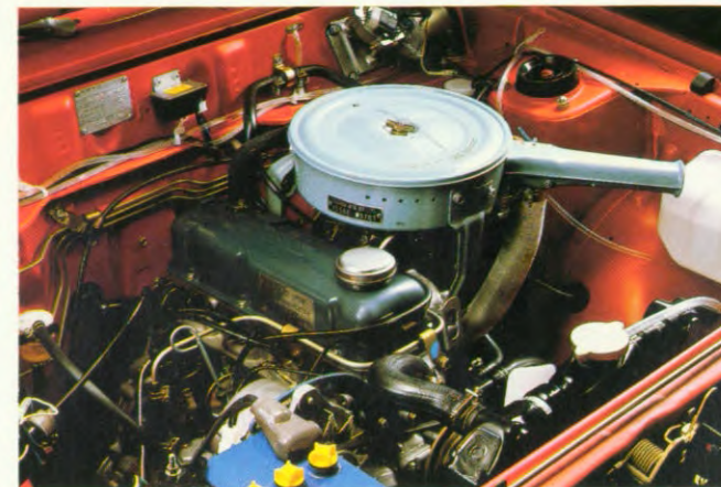
1400 cm 3 motor