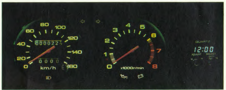
dashboard "GL" met toerenteller en digitaal klok