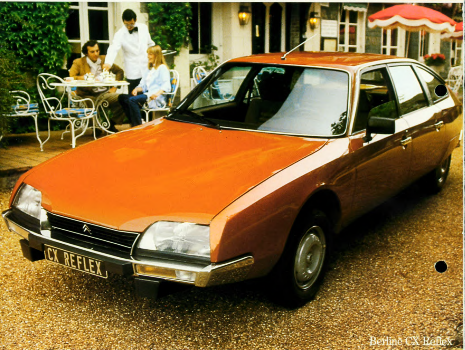
Berlinè CX Reflex