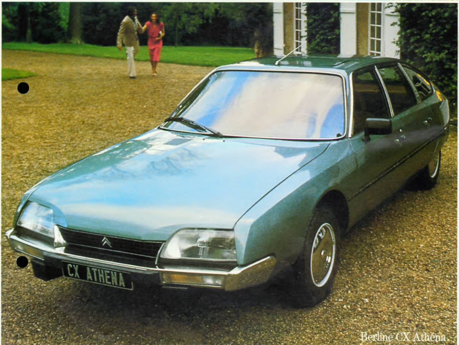
Berline CX Athéna.