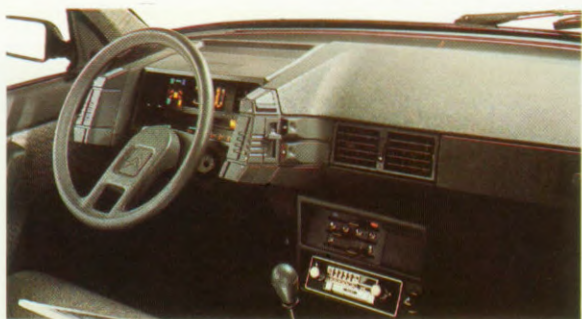
Autoradio via de Accessoire.