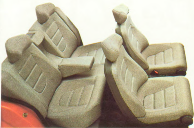
Interieur van een BX 16 TRS met achterhoofdsteunen via de Accessoire.