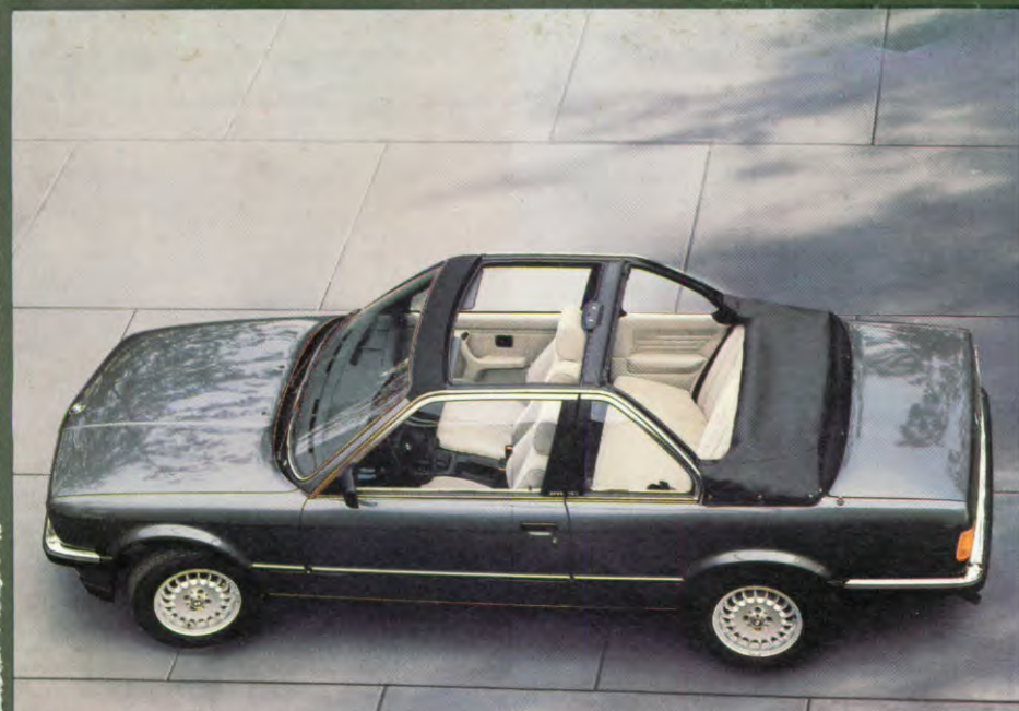
BMW 320i, Baur Cabrio, als extra: BMW lichtmetalen velgen, aut. versnellingsbak, radio