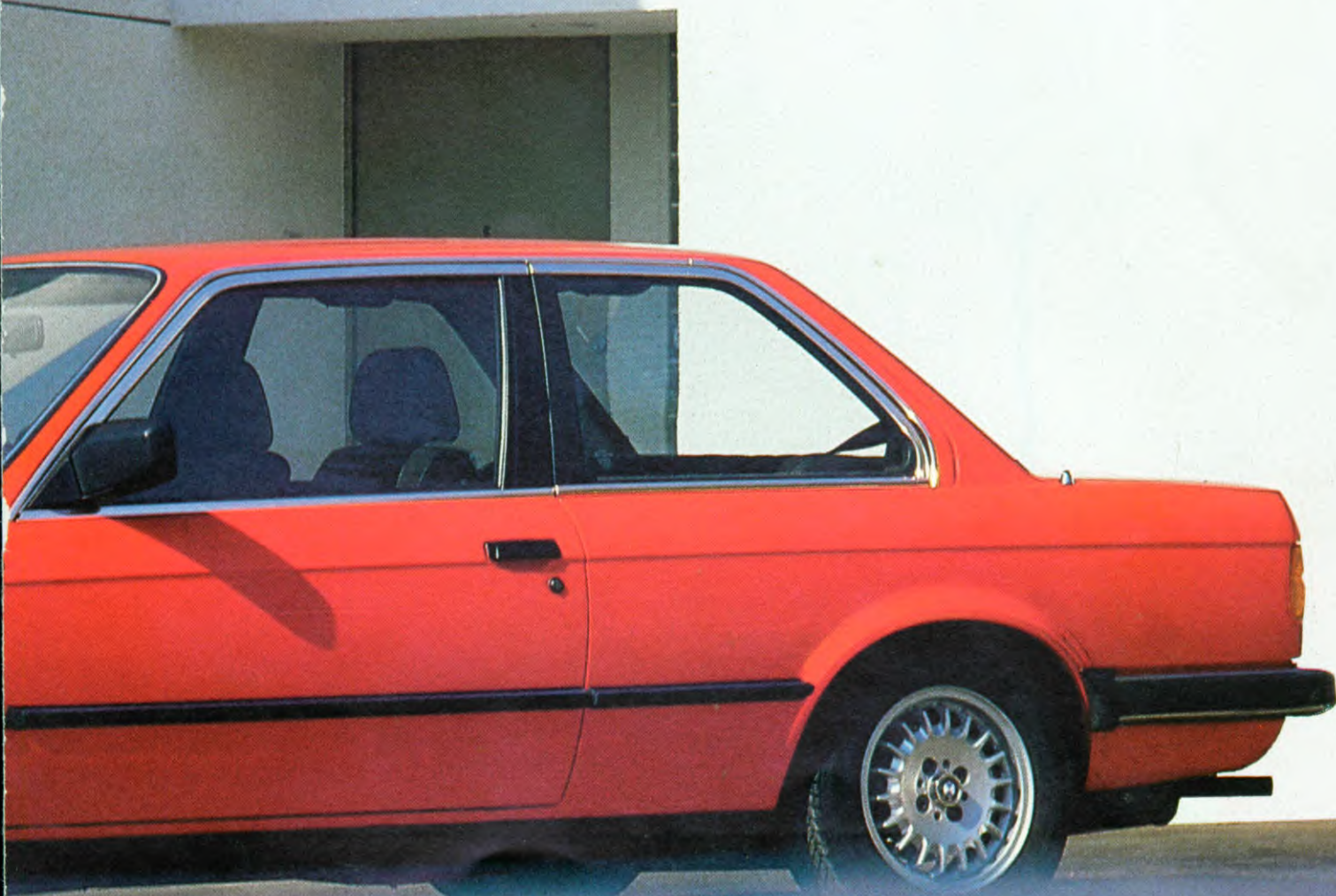
BMW 318i Als extra leverbaar: BMW lichtmetalen velgen, radio-installatie