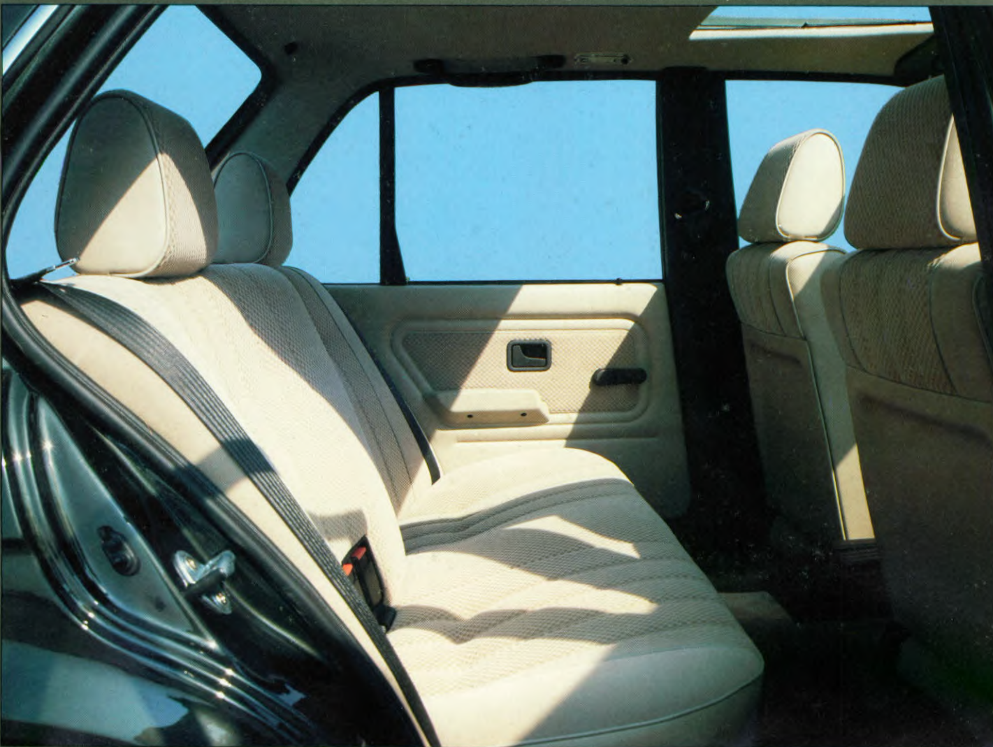
BMW 320i, als extra leverbaar: stalen kantelbaar schuifdak, hoofdsteunen achter