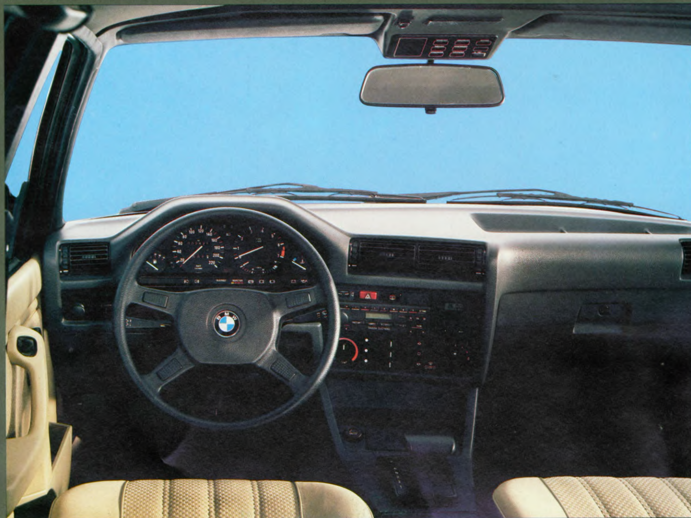
BMW 320i, als extra leverbaar: automatische versnellingsbak, elektrisch bediend stalen kantelbaar schuifdak, BMW Bavaria electronic radio