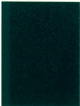
322 Nauticgrün 1)