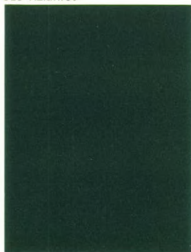
329 Vulkangrau 1)

1) Diese Farben sind nicht erhältlich für das Coupé.