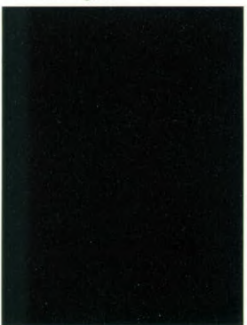
668 Schwarz II