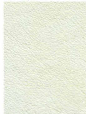
0394 Silbergrau hell