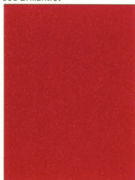
315 Tizianrot 1)