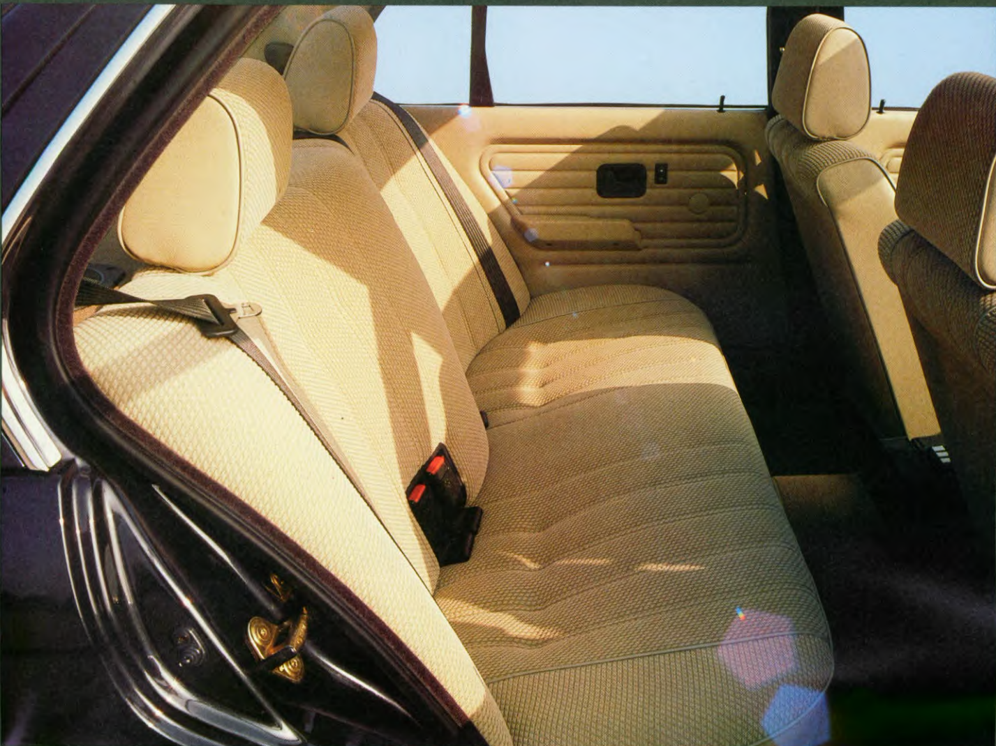
BMW 320i 4-deurs, als extra leverbaar: hoofdsteunen achter, metallic-lak, elektrisch te bedienen zijramen, cassettehouder