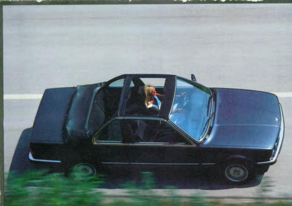
BMW 320i, Baur Cabrio, als extra: metallic lak, BMW lichtmetalen wielen, aut. versnellingsbak, radio