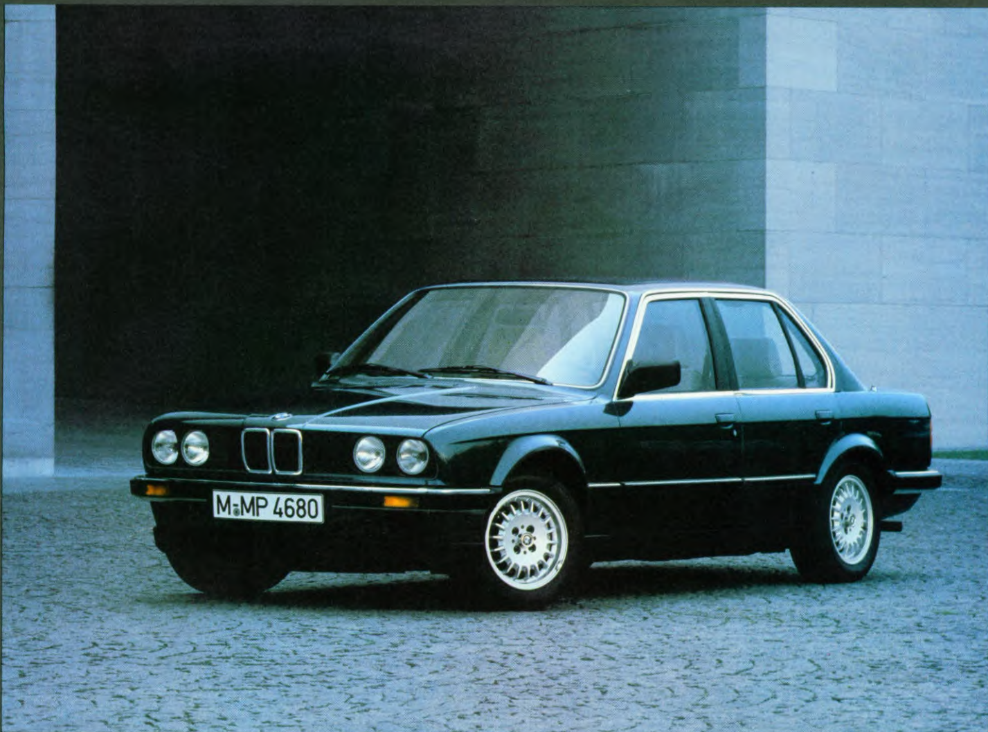
BMW 320i 4-deurs, als extra leverbaar: metallic-lak, BMW lichtmetalen wielen, rechter buitenspiegel, hoofdsteunen achter, radio-installatie