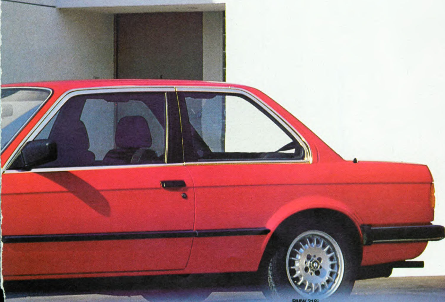
BMW 318i Als extra leverbaar: BMW lichtmetalen wielen, radio-installatie

Op deze wijze wordt de garantie geboden dat deze automobielen steeds aan de hoogste eisen van hun berijders kunnen voldoen.