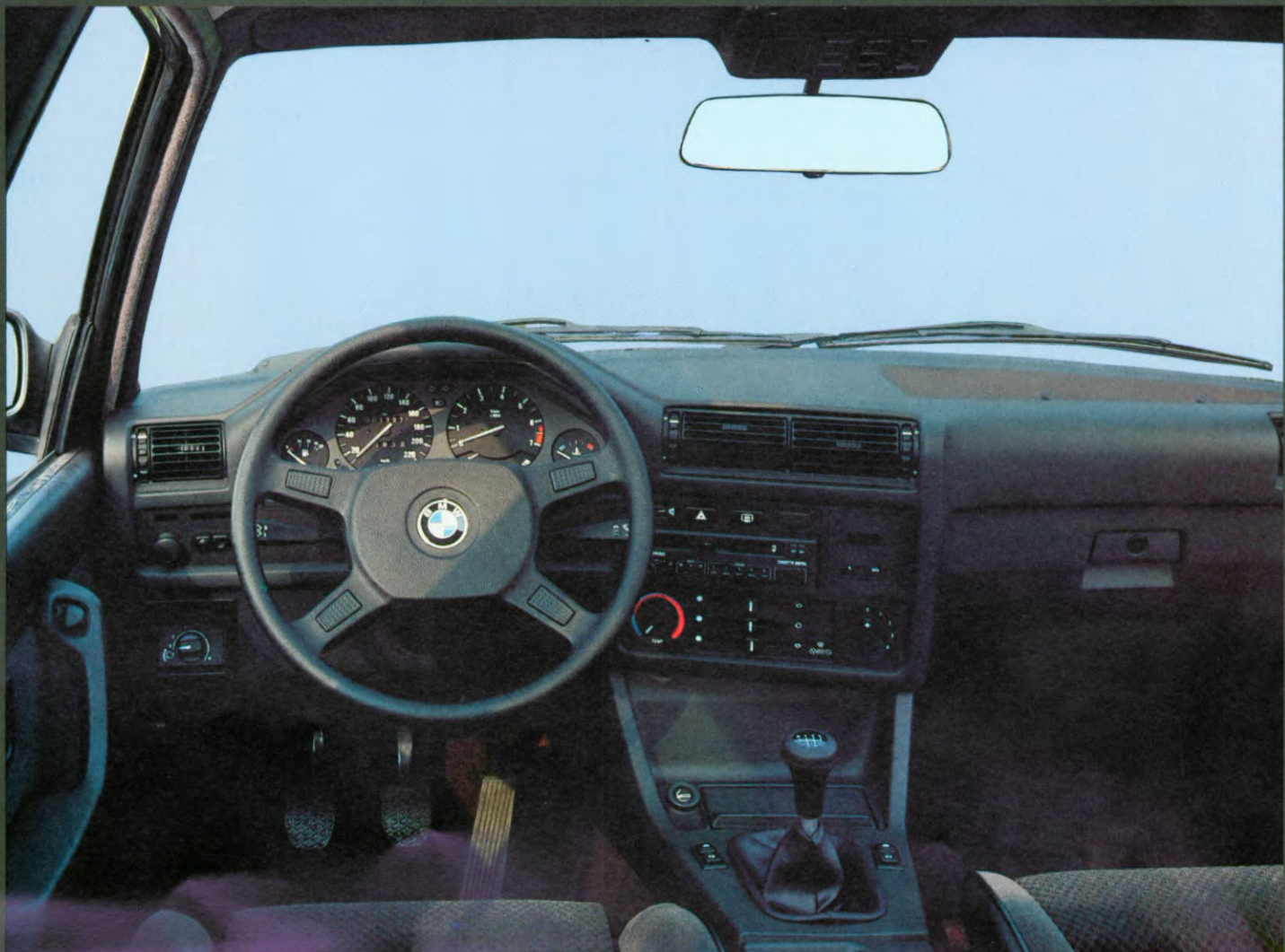
BMW 320i, als extra leverbaar: elektrisch bedienbaar kantelbaar schuifdak, elektrisch te bedienen zijramen voor, rechter buitenspiegel, in hoogte verstelbaar, dimlicht, radio BMW Bavaria CR Digital.