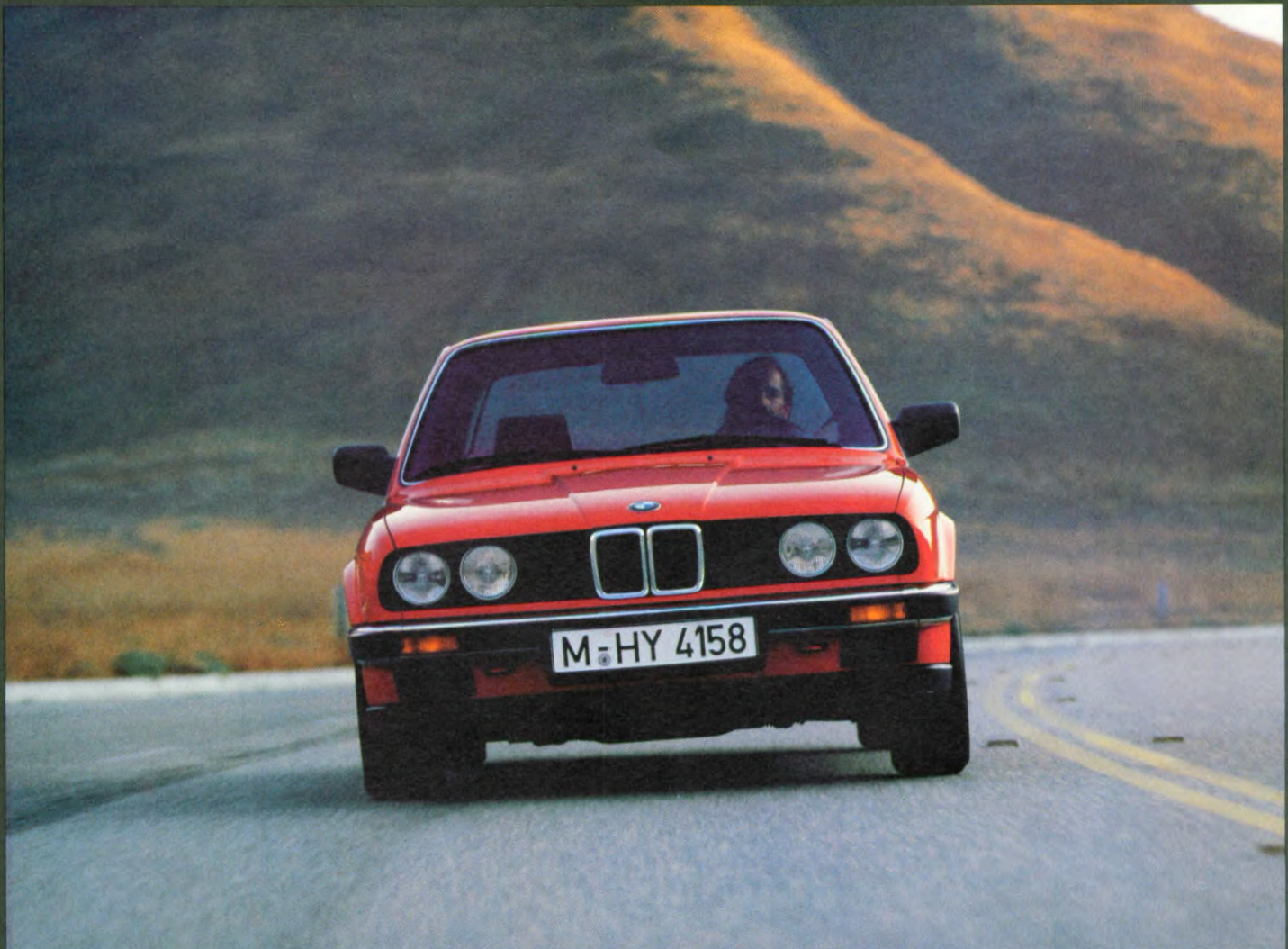
BMW 318i, als extra leverbaar: 60-seriebanden 195/60 HR 14, rechter buitenspiegel