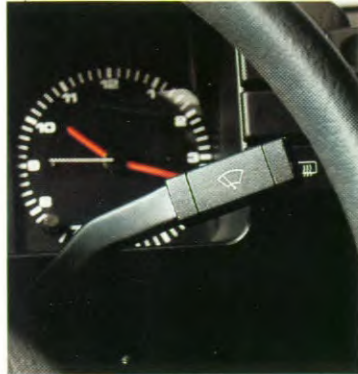
Ruitewisser, 2 snelh. tip/wis contact