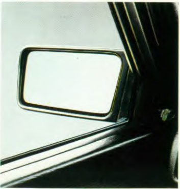
Van binnenuit verstelbare spiegels