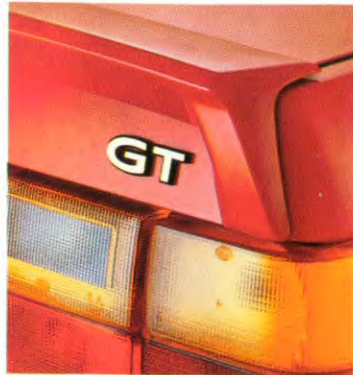
Achterspoiler in de kleur van de auto