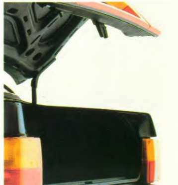
2 gasdrukveren voor de bagageklep