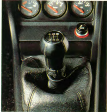
Pookknop met lederen overtrek