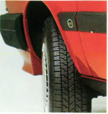
175/70 SR 13 banden