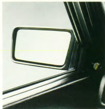
Van binnenuit verstelbare spiegels