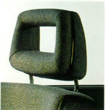
Verstelbare open hoofdsteunen voor