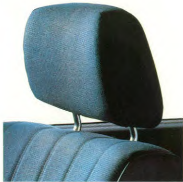
Verstelbare hoofdsteunen voor