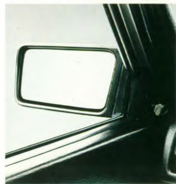
Van binnenuit verstelbare spiegels