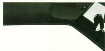
Telescoopantenne en stereoradio-voorbereiding