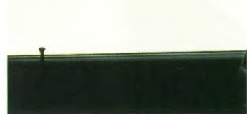
Groen warmtewerend glas