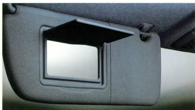
zonneklep bestuurderszijde met make-up spiegel en afdekplaatje