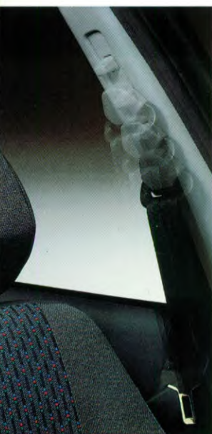
in hoogte verstelbare veiligheidsgordels vóór