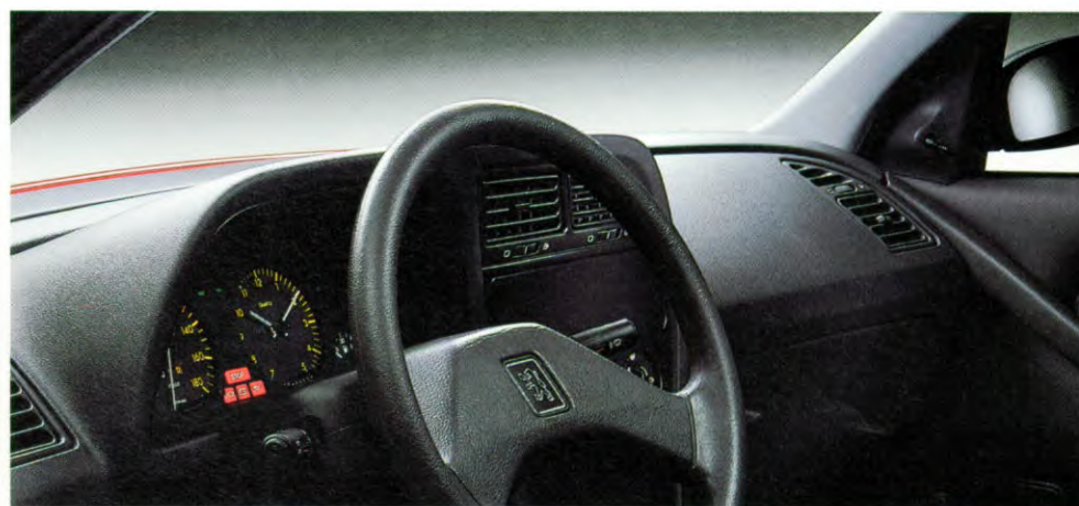
twee-spakig stuurwiel, in hoogte verstelbaar