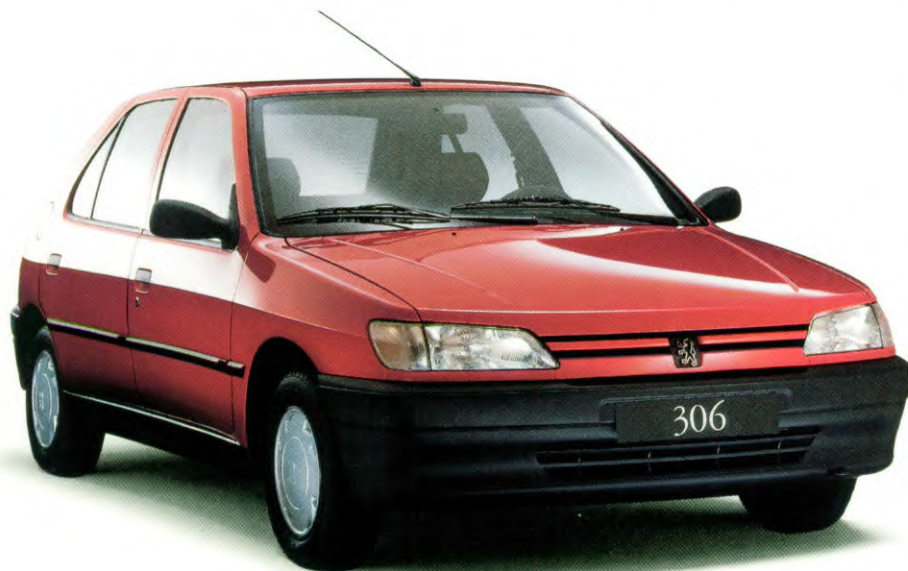
Peugeot 306 XN 1.4