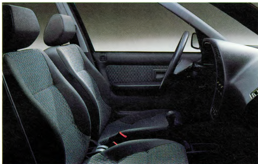
volledig ergonomisch ontwikkelde voorstoelen