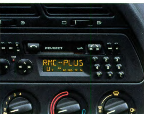
autoradio tegen meerprijs