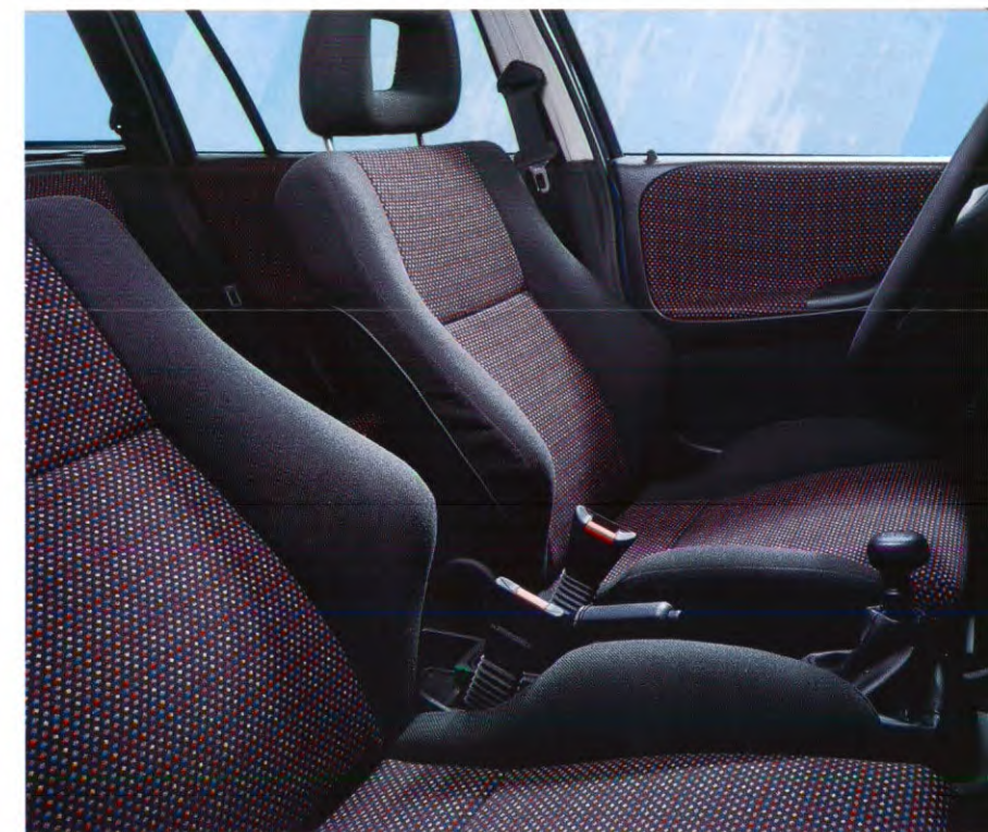
De antracietkleurige „Petit Point”-stoel- en portierbekleding geeft de Astra Sportive een extra sportieve „look”.

glas. Maar ook brede „185/60”-banden met stalen „5½ J x 14”-velgen en GSi-wieldoppen. Bovendien kunt u een transparant schuif-/kanteldak en speciale lichtmetalen velgen tegen meerprijs bestellen. De Astra Sportive is er in een 3-, 4- of 5-deurs uitvoering, terwijl ook een trendy stationwagon leverbaar is. Bovendien zijn er bedrijfswagenuitvoeringen te bestellen op basis van de 3-deurs uitvoering.