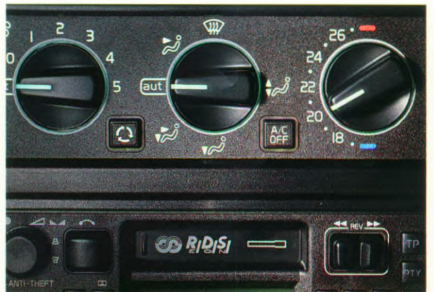
Electronic Climate Control