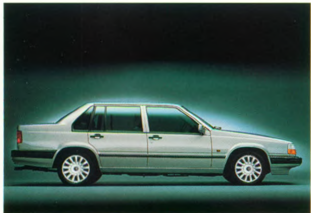
Volvo 940 Malmö Sedan